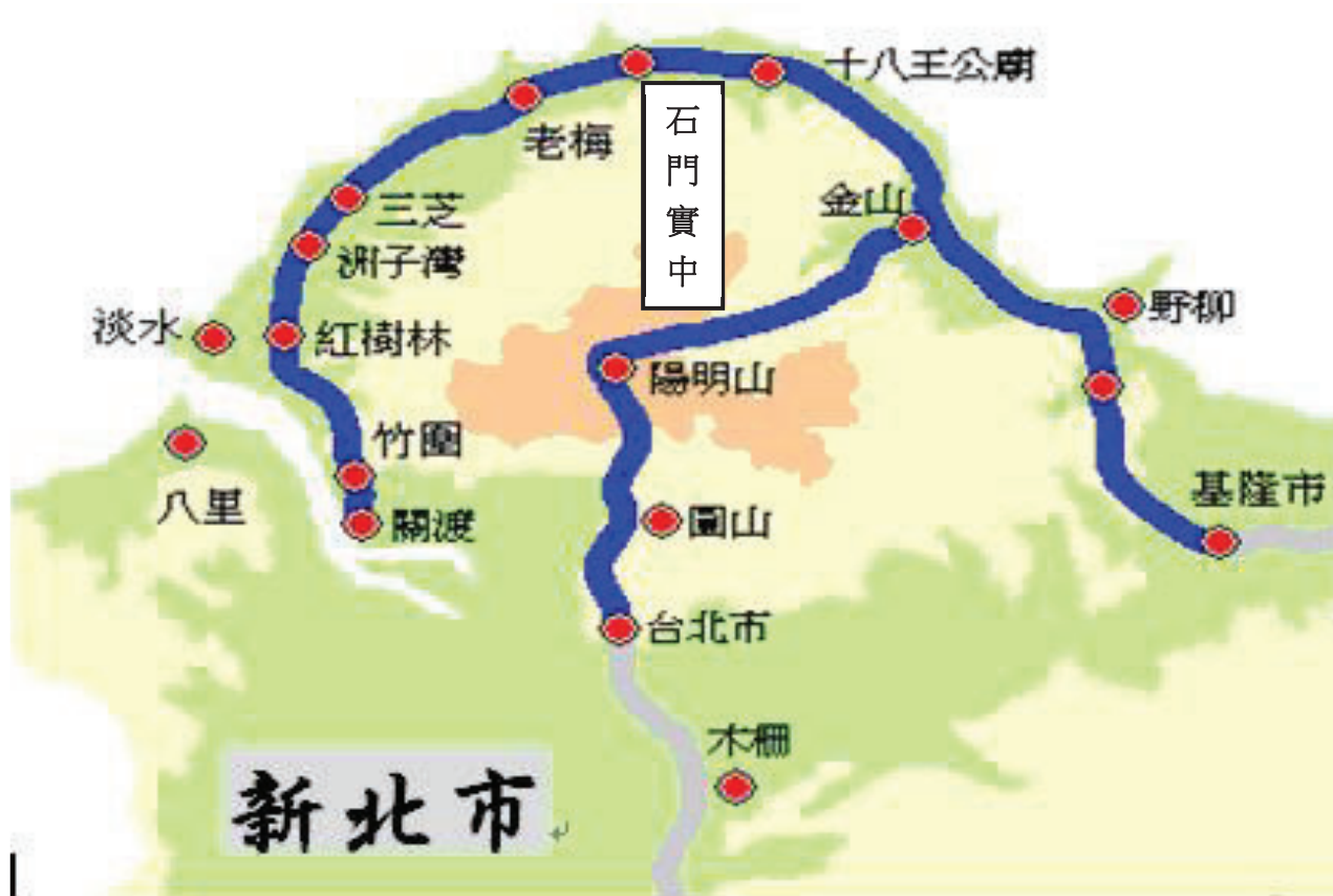
(四)石門實中交通位置圖